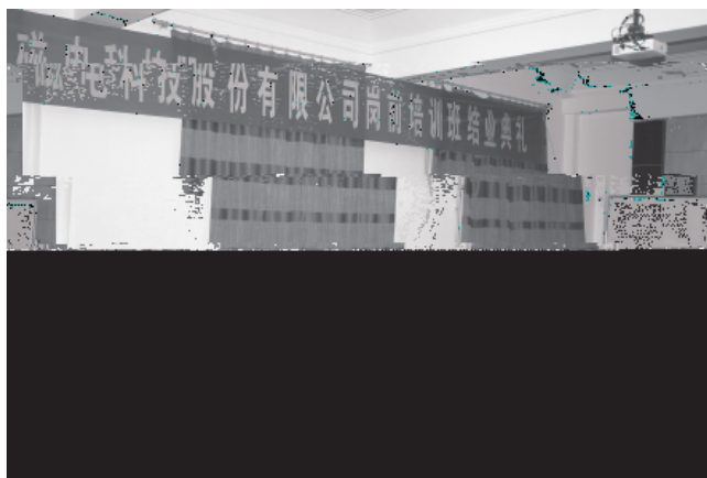
岗前培训结业：山东大学机械工程学院为山东华特磁电科技股份有限公司举办的员工岗前培训班在山东大学机械工程学院会议室举行结业典礼。

培训费为每年3000元/人，在山东大学校内脱产上课期间住宿费1200元/人（以山东大学当年收费文件为准），教材费预收500元/人，结业时多退少补。取得山东大学网络教育学籍的学员，需缴纳学费6000元（以当年物价局规定为准），按山东大学网络教育招生规定时间分两次缴纳。