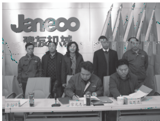
建友签约: 山东大学与山东建设机械股份有限公司联合举办研究生课程进修班签约仪式在山东建设机械股份有限公司会议室举行。