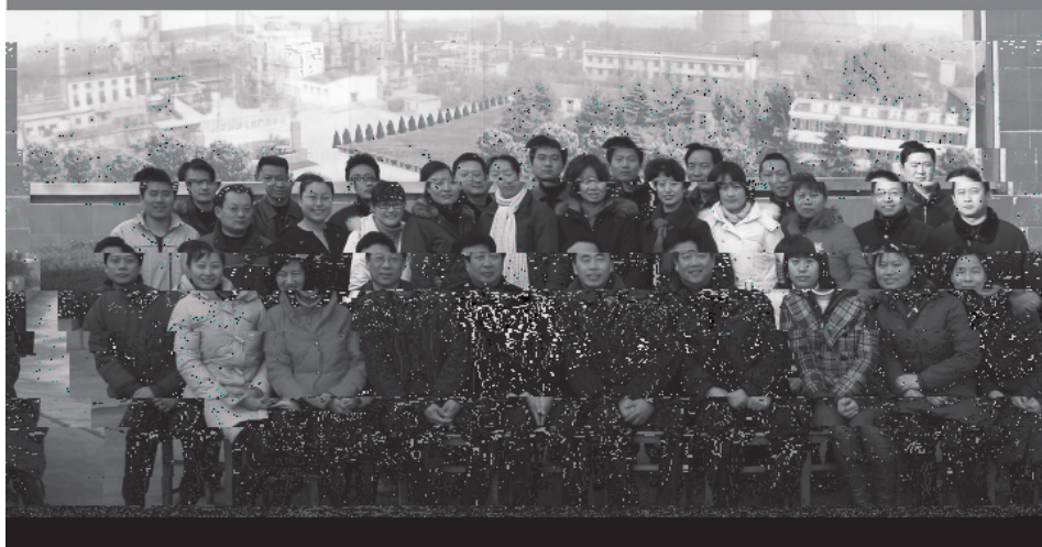
焦化厂班毕业合影：山东大学与兖州矿业集团焦化厂联合举办的山东大学成人高等教育函授班毕业学员在邹城市兖州矿业集团焦化厂合影留念。