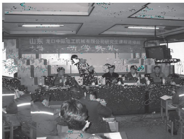
中际开班 山东大学机械工程学院与山东中际电工机械有限公司联合举办的研究生班开学典礼在龙口市的中际电工机械有限公司举行。