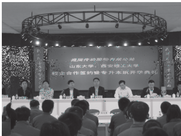
盛瑞开班 山东大学与盛瑞传动股份有限公司联合举办的成人高等教育函授班开学典礼在潍坊市盛瑞传动股份有限公司举行。

按照国家教育部的要求，为解决函授生的工学矛盾，方便学生学习，山东大学在山东省的大部分地市设立了函授教学站。录取后，大部分函授生可在当地函授站参加学习。各函授站的招生专业及学习方式，请咨询您所在地市的山东大学函授站（各地市函授站地址及咨询电话见山东大学成人高等教育当年招生简章）。